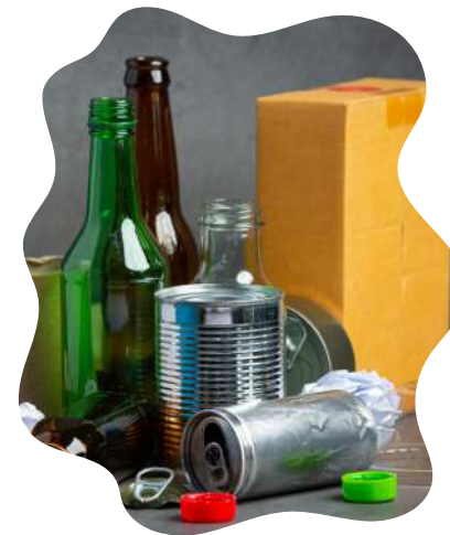
Separo para reciclar o para disposición final