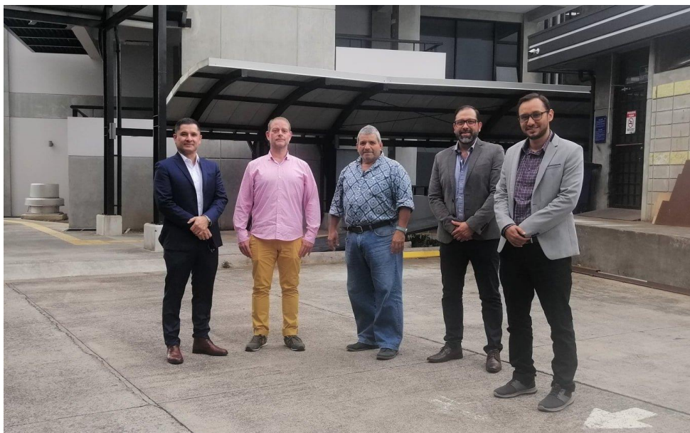
Fotografía: directores de las cinco editoriales universitarias públicas costarricenses.