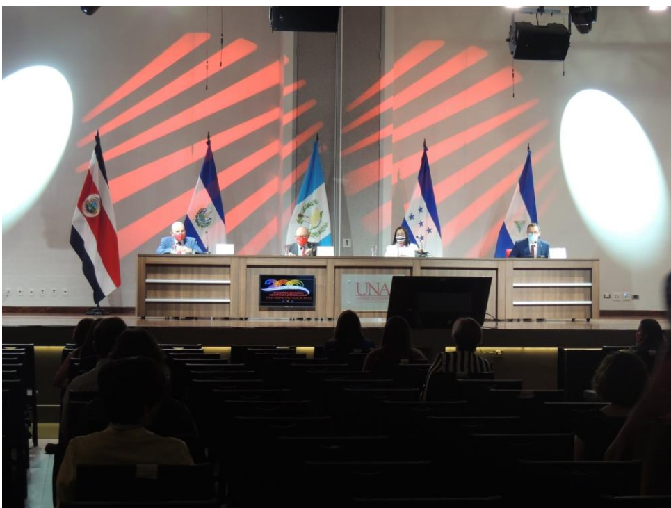
Acto de presentación de la Colección de Oro (setiembre 2021)