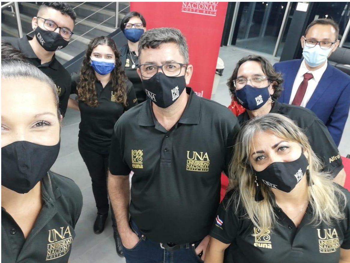
Equipo administrativo EUNA – Colección del Bicentenario (setiembre 2020)