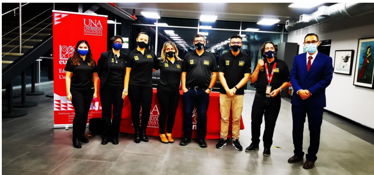
Fotografía: equipo administrativo de la EUNA durante la presentación de la Colección del Bicentenario (setiembre, 2021).

La Universidad Nacional ha enfrentado procesos estructurales, pero también internos que han dificultado la ejecución eficiente de los recursos, así como la atención de las necesidades. A pesar de lo anterior, durante mi gestión se ha trabajado de la mano y de forma colaborativa con todas las instancias con el claro propósito de dotar a nuestra casa editorial con las mejores herramientas para cumplir con su misión.