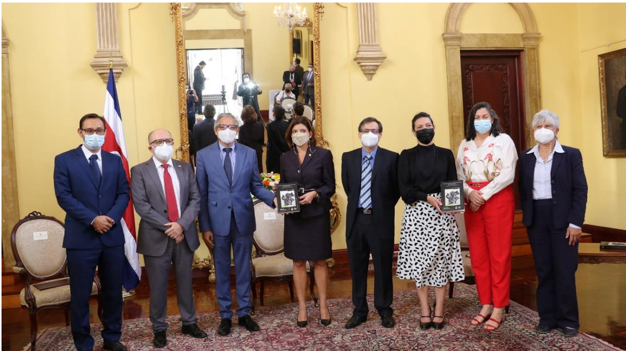
Fotografía: Presentación libro Colección Bicentenario en Cancillería (enero 2022).