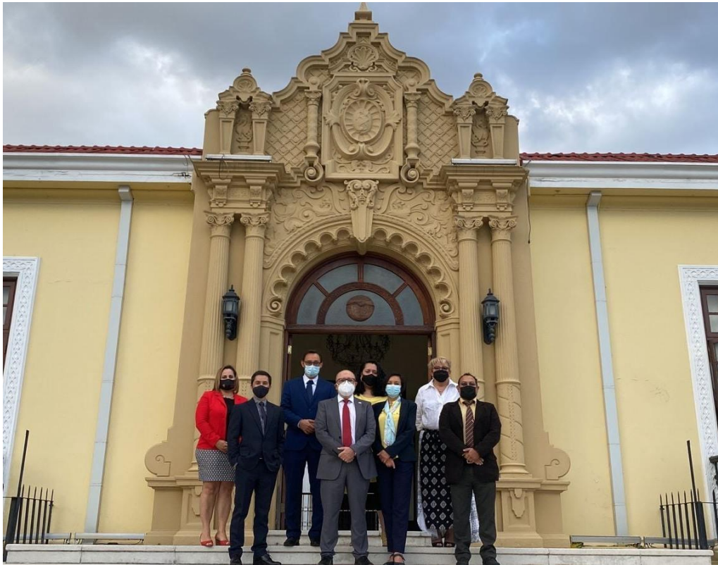
Consejo Editorial UNA y Sr. Rector UNA, Ministerio de Relaciones Exteriores y Culto