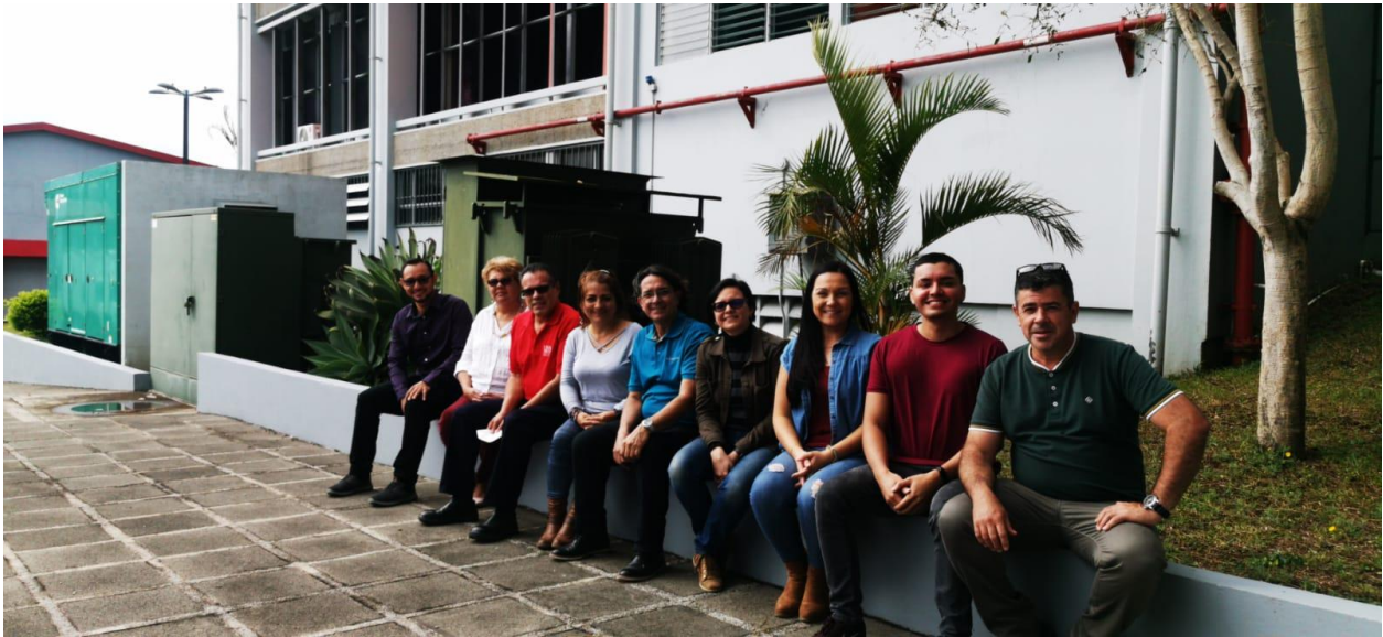
Equipo administrativo de la EUNA (diciembre 2021)