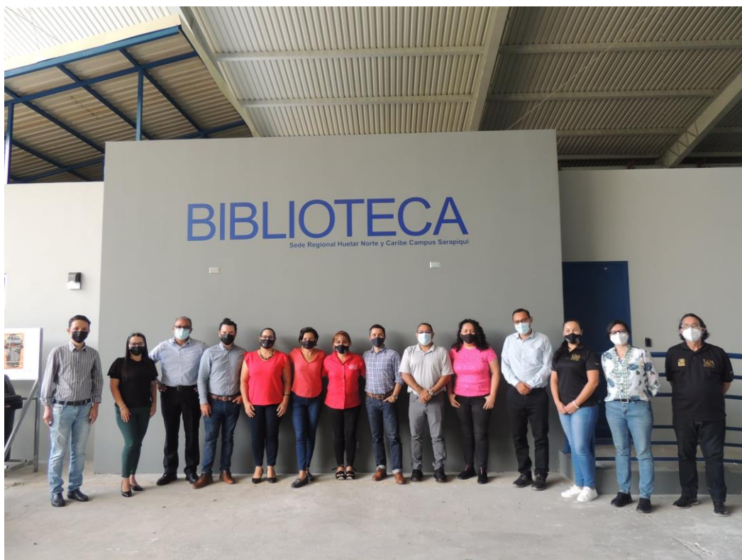
Consejo Editorial UNA y personal EUNA, Campus Sarapiquí (diciembre 2021)