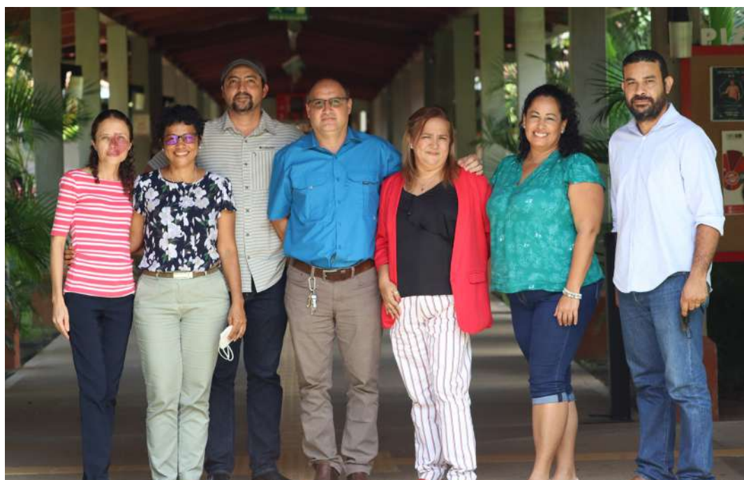
Equipo de Gestión 2022-2027