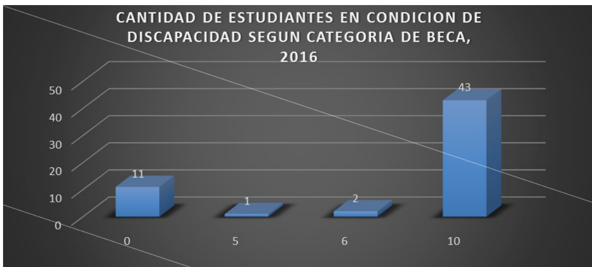
GRÁFICO N° 2

Respecto a la categoría de beca por condición socioeconómica, 43 estudiantes cuentan con una exoneración total en el pago de los créditos y 11 estudiantes con exoneración parcial.