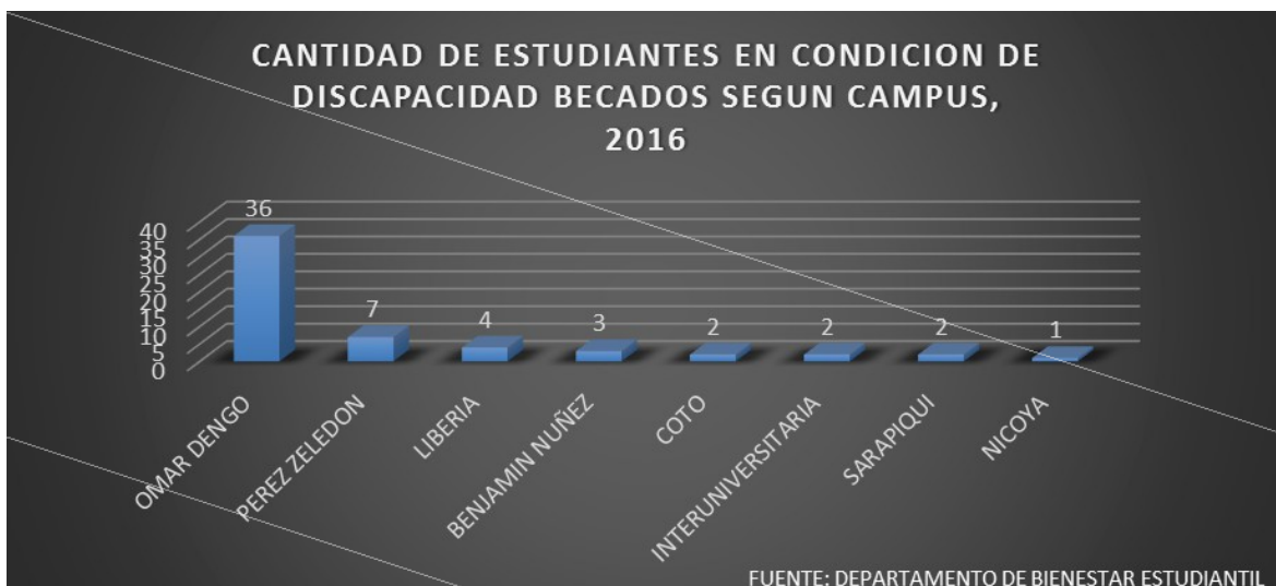
GRÁFICO N° 4

Respecto a la distancia por campus de estudiantes con discapacidad con beca, 36 se ubican en el Campus Omar Dengo, siete en el Campus de Pérez Zeledón, siendo ambos donde hay mayor representación de esta población.