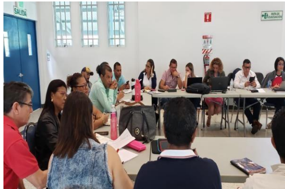
Fotografía N. 1, sesión de trabajo del OCIR con las autoridades Municipales electas en la región Huetar Norte.