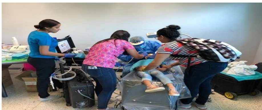
Feria de Salud para estudiantes de Carreras itinerantes y sus familias, territorio norte Octubre 2019.

Desarrollo de Alianzas esenciales para la prestación de servicios de salud a los estudiantes de carreras itinerantes que reciben clases fuera de los campus universitarios.